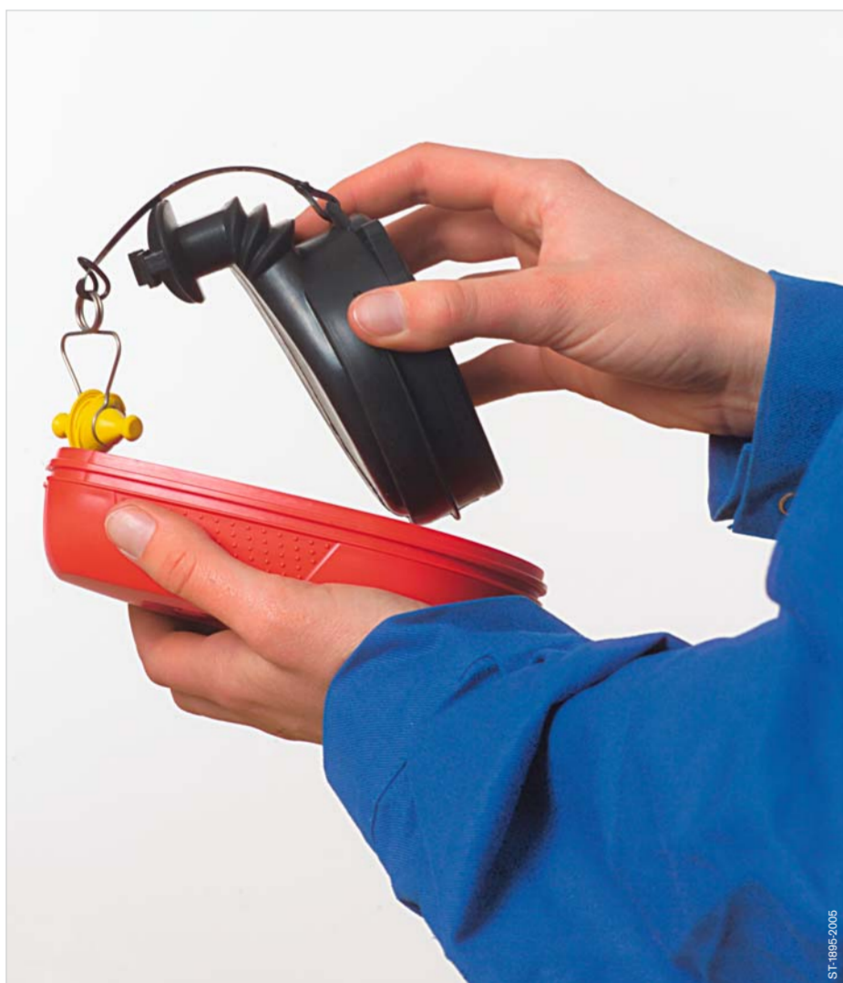
Take out the unit.