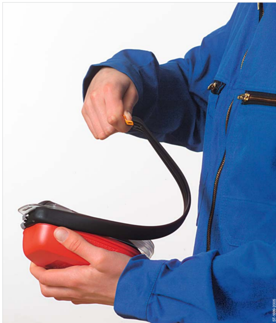
Remove the sealing band.