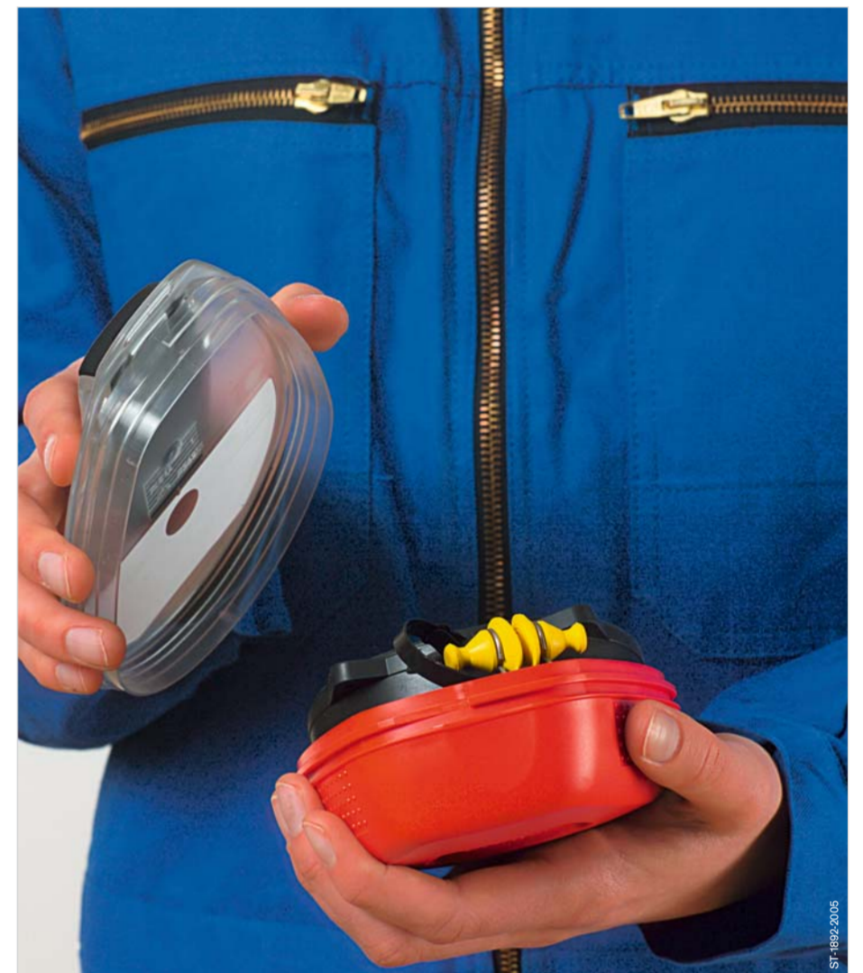
Open the housing.