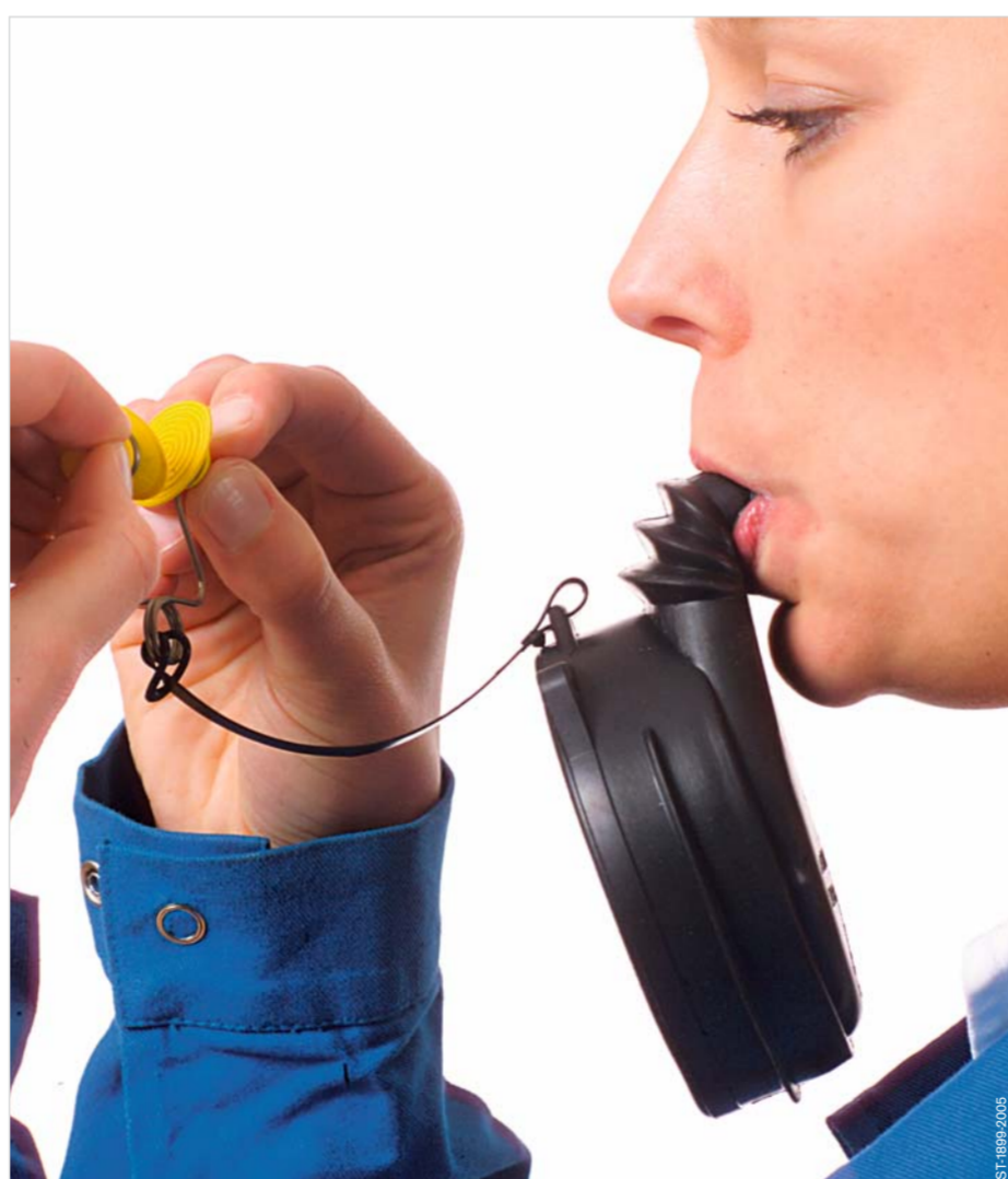
Mundstück in den Mund stecken und mit den Lippen umschließen. Die Beißzapfen mit den Zähnen halten. Die Nasenklemme auseinanderziehen.