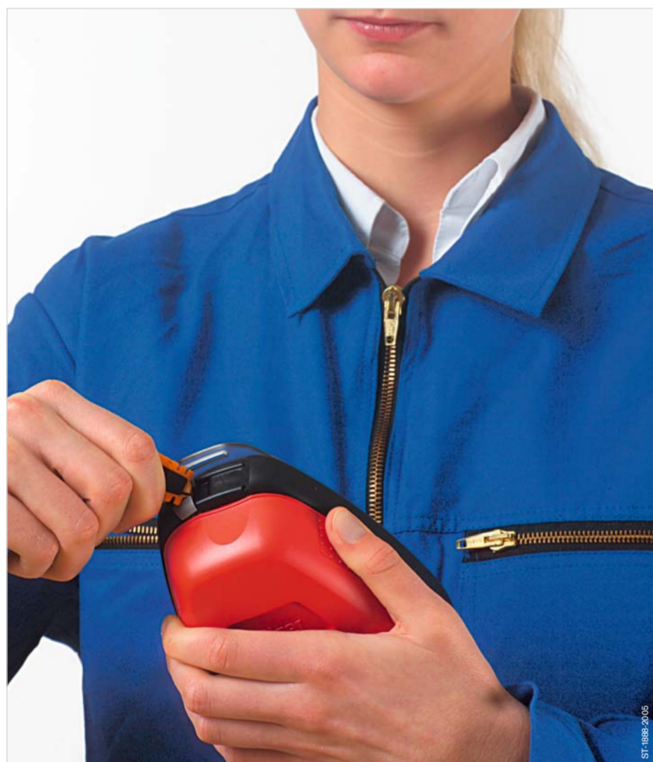
Plombe mit der Lasche aufreißen.